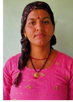
अनार कलि (सदस्य)